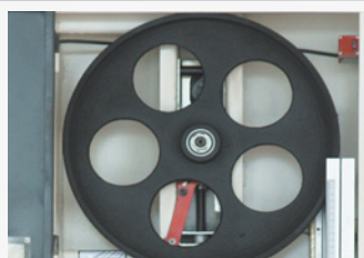
● Volantes de radio fabricados en fundición de aluminio

Máquinas de uso semiprofesional. Volantes y mesa de trabajo en fundición gris. Motor equipado con electrofreno. Horquilla reforzada.