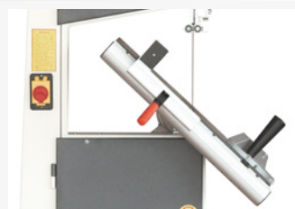
● Mesa inclinable de 0° a 45°