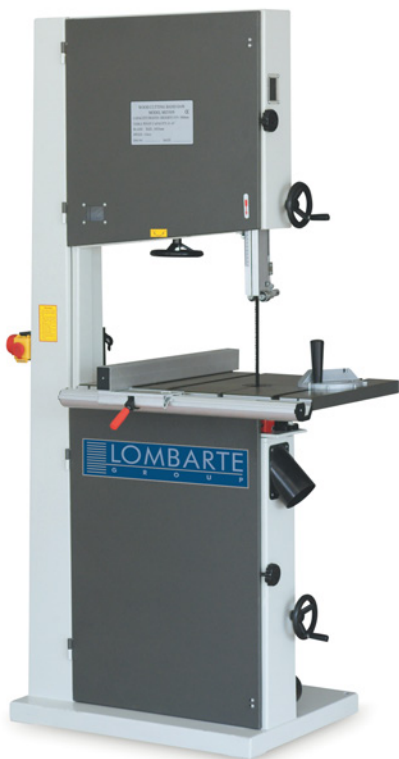
BASS 500 E / BASS 600 E VISTA FRONTAL