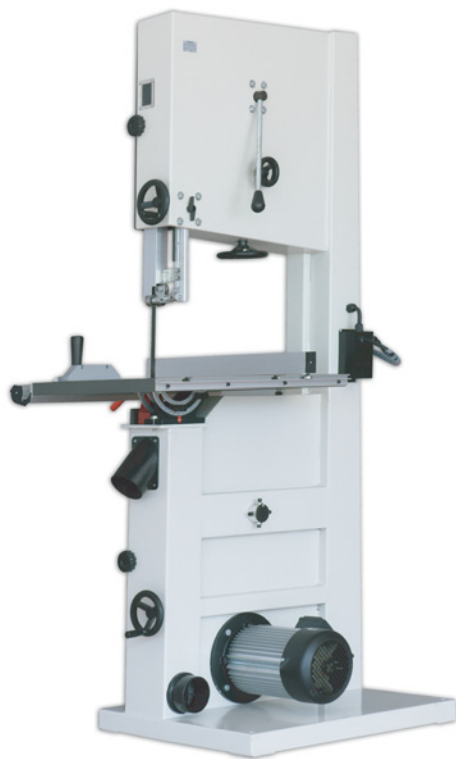
BASS 500 E / BASS 600 E VISTA POSTERIOR