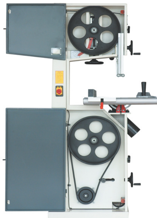
BASS 500 E / BASS 600 E INTERIOR