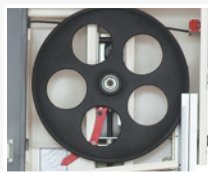
HBS 400 N