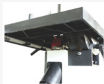
HBS 355 C

Sierra cinta, equipada con base de serie, guía paralela y guía a ingletes, volantes radio de fundición.