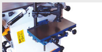
Pie de taladrar con regulación X Y Z