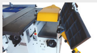
Función regreuso levantando mesas de cepillar