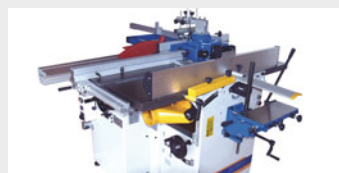
Guía cepillar inclinable